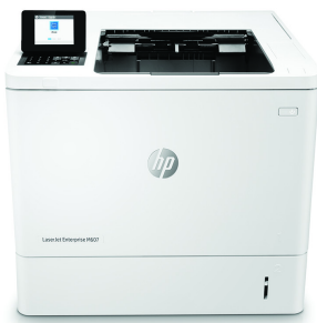
HP LaserJet Enterprise M607n

Denna HP LaserJet-skrivare med JetIntelligence kombinerar hög prestanda och energieffektivitet med dokument av professionell kvalitet direkt när ni behöver dem – allt medan nätverket skyddas mot attacker med branschens bästa säkerhet. 1