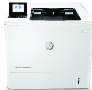
HP LaserJet Enterprise M607dn

Dynamisk säkerhetsaktiverad skrivare. Endast avsedda att användas med patroner/kassetter som har ett äkta HP-chip. Patroner/kassetter som har ett chip som inte är från HP kanske inte fungerar, och de som fungerar idag kanske inte fungerar i framtiden. Läs mer på: http://www.hp.com/go/learnaboutsupplies