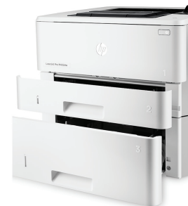
HP LaserJet Pro M402dn med fack för 550 ark som tillval