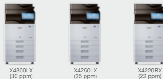
X4300LX (30 ppm)